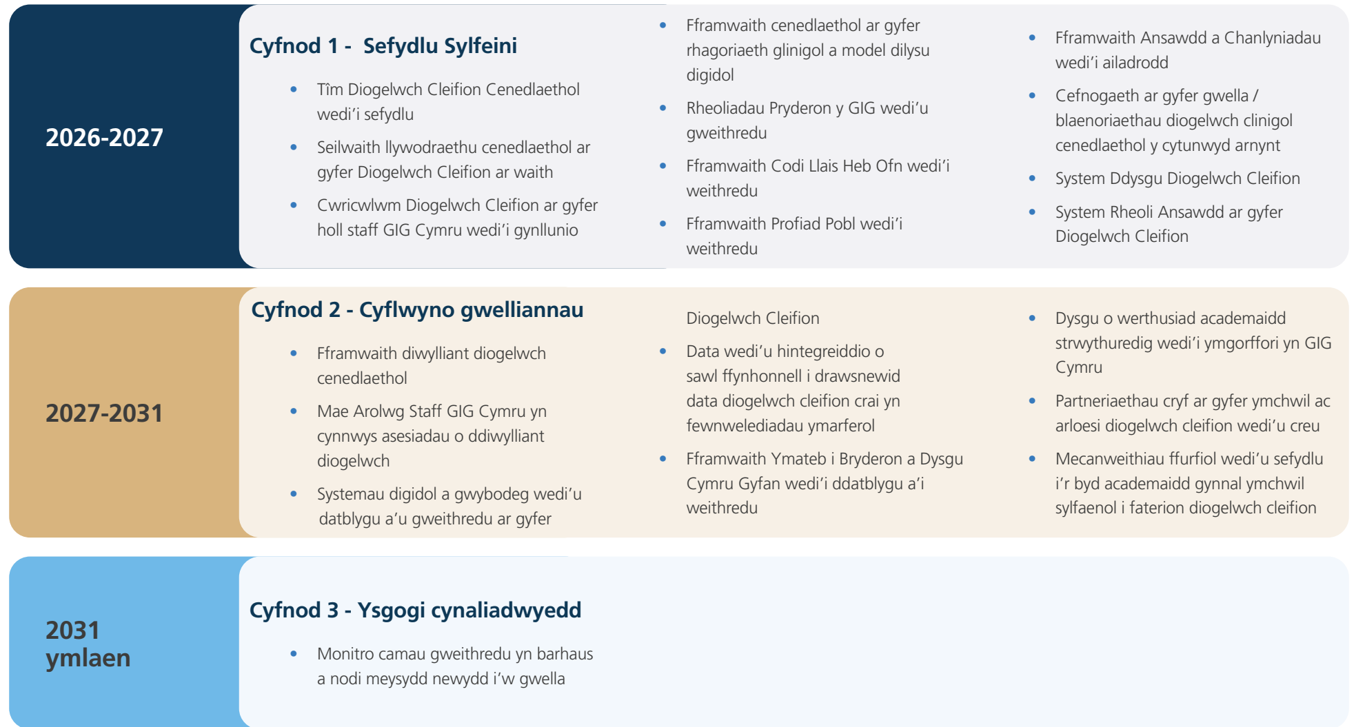
Ffigur 3: Crynodeb o gyflawni'r camau gweithredu'n raddol